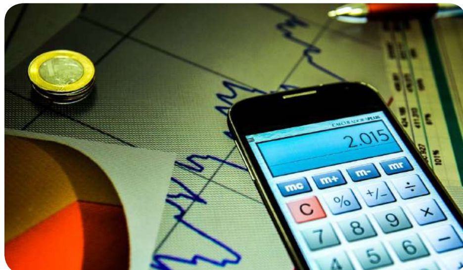
Brasil é campeão dos juros reais pelo quarto ano consecutivo

só poderá crescer 70% da expansão da receita, sempre limitado ao teto de 2,5%