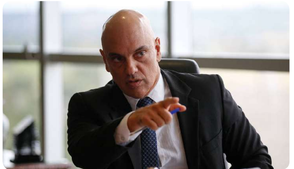
O ministro Alexandre de Moraes considerou abusiva a ação do PL para anular eleições

O relatório no qual pede a anulação do segundo turno curiosamente não diz nada sobre o primeiro turno, no qual o PL elegeu a maior bancada e vários governadores nas mesmas urnas.