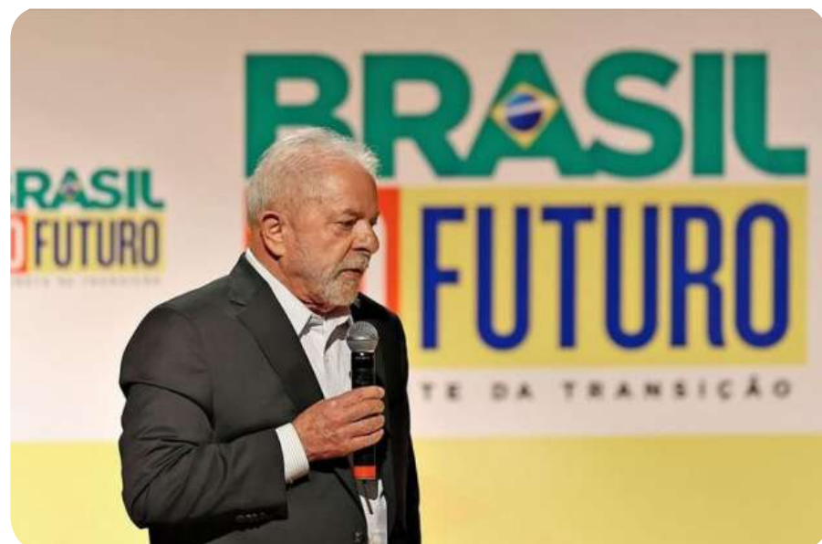
É preciso pacificar o país e construir o Brasil do futuro que queremos!

Por isso precisamos unificar toda a população para construir esse novo Brasil. É preciso cobrar do governo Lula que coloque novamente os trabalhadores e a população pobre como prioridade. A disputa eleitoral já chegou ao fim, com a vitória de Lula. É hora de construir o Brasil do futuro que queremos!