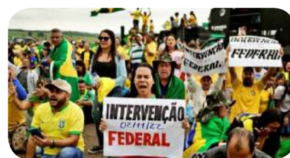
Mapa do Brasil mostra divisão política entre estados com maioria de eleitores de Lula e de Bolsonaro. Acima, apoiadores de Bolsonaro pedem golpe militar “para garantir a ordem” no país