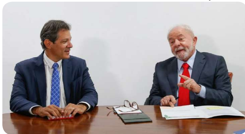
Reforma Tributária de Fernando Haddad e Lula segue para votação no Senado

Agora será preciso mobilização para cobrar a segunda fase da reforma, com o imposto sobre grandes fortunas, a ampliação da progressividade dos impostos sobre a renda e a criação de um imposto sobre lucros e dividendos. Vamos à luta!