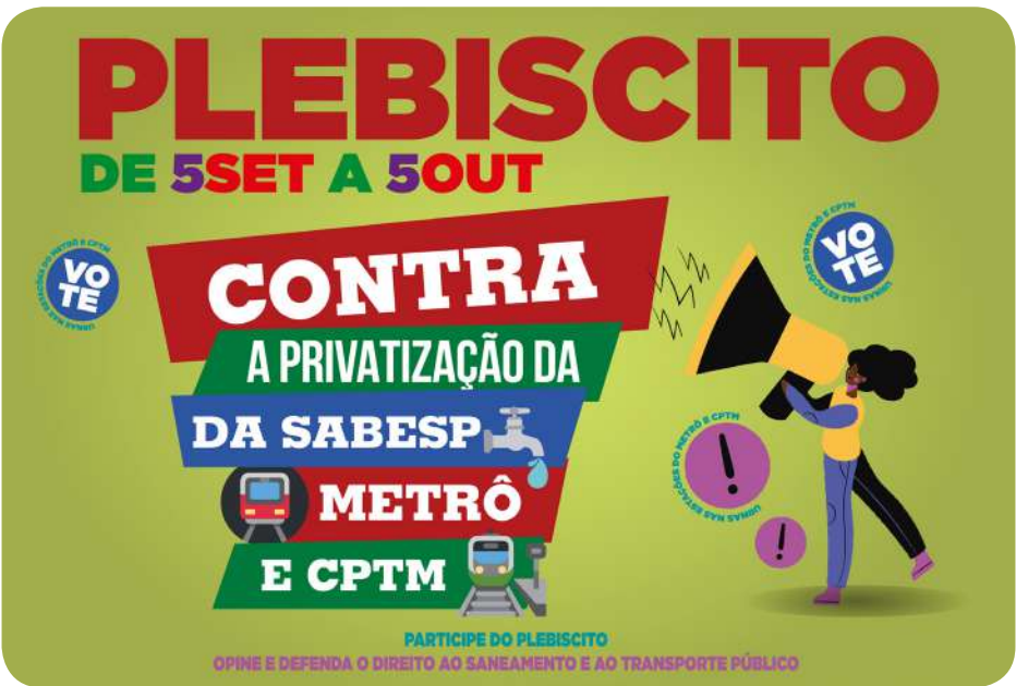
Além da greve do dia 3, trabalhadores realizam plebiscito contra privatizações

imediate paralisação do processo de privatizações encabeçado pelo governador e o cancelamento dos pregões de terceirizações do Metrô.