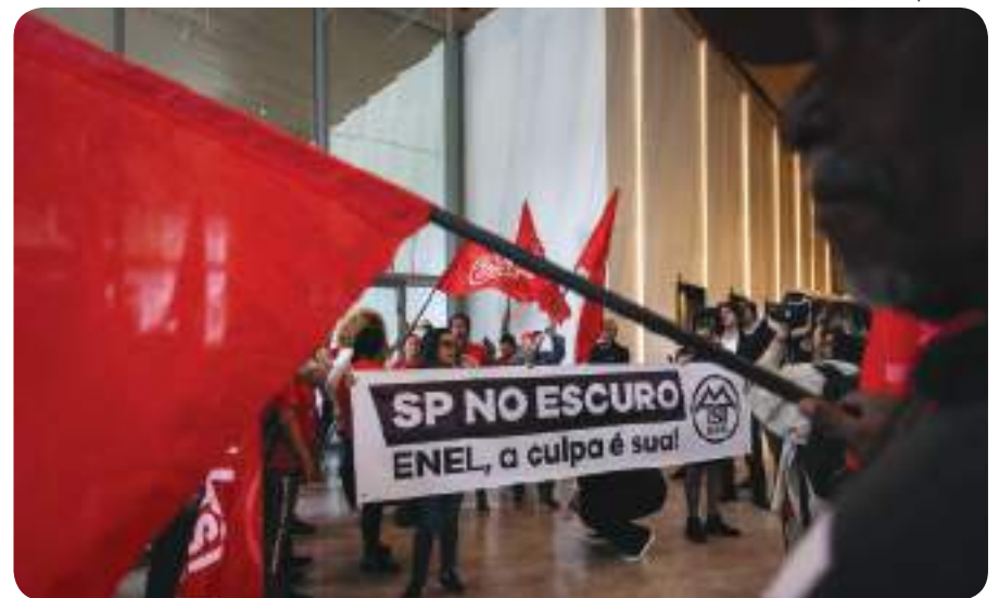
MTST realizou protesto em frente à sede da empresa Enel

A empresa hoje é alvo de duas CPIs, na Câmara Municipal e na Assembleia Legislativa de São Paulo. Os parlamentares questionam o engugamento no efetivo e a utilização de equipamentos antigos e defasados, da década de 60, no parque elétrico. Privatiza que piora!