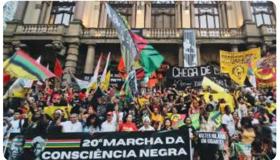
Marcha defendeu políticas para enfrentamento da desigualdade racial

Precisamos enfrentar o racismo e lutar por políticas que combatam a desigualdade racial na sociedade!