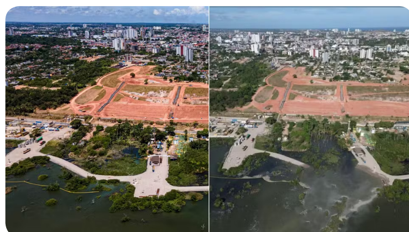
Fotos mostram antes e depois do colapso da mina 18, sob a lagoa Mundaú

A mineração na região começou na década de 70. Ao todo são 35 minas que ficam a 1.200 metros de profundidade e passam por medidas para tentar impedir que também sofram colapso.