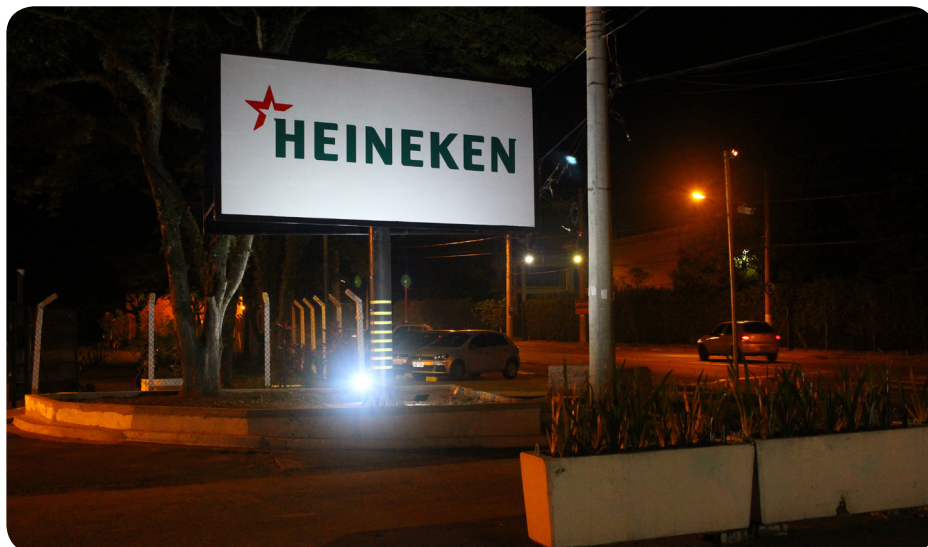
Apesar dos resultados acima do esperado, Heineken ataca direitos históricos

ambientes insalubres, verdadeiros fornos, pois as linhas de produção foram isoladas e não há ventilação adequada. Sem falar na falta constante de equipamentos adequados e EPIs.