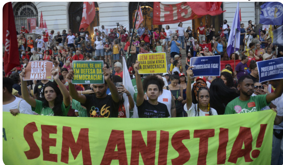
Manifestantes pediram a prisão dos golpistas, incluindo o líder Bolsonaro

Através de cartazes e cantos, os manifestantes pregaram a união de todos em defesa da democracia e exigiram: sem anistia aos golpistas!