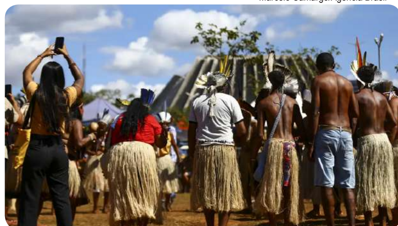
Milhares de indígenas são esperados no 20º Acampamento Terra Livre