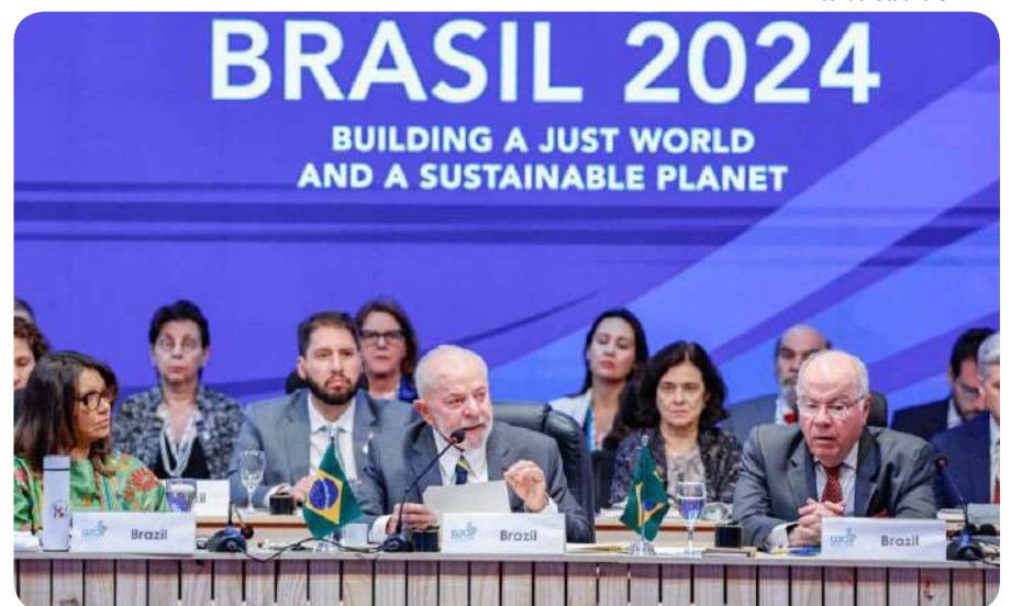
Proposta tem apoio de países como França e Estados Unidos

Nos últimos 30 anos, a riqueza dos bilionários passou de 4% do Produto Interno Bruto (PIB) mundial para quase 14%. A medida é fundamental para combater o aumento da desigualdade no planeta.