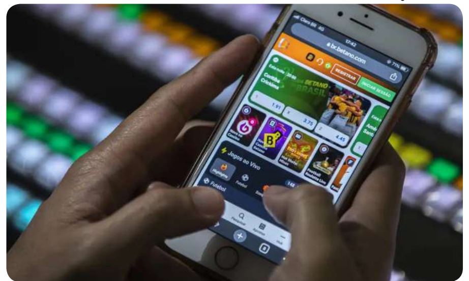
Bets têm comprometido orçamento das famílias e aumentado vício em jogos

O governo Lula regulamentou o setor em 2023 e proibiu a utilização de benefícios, como o Bolsa Família, para apostas. A regulamentação tirou de circulação mais de 2 mil sites, no entanto, Lula afirmou em entrevista que pode proibir as bets se a regulamentação falhar.