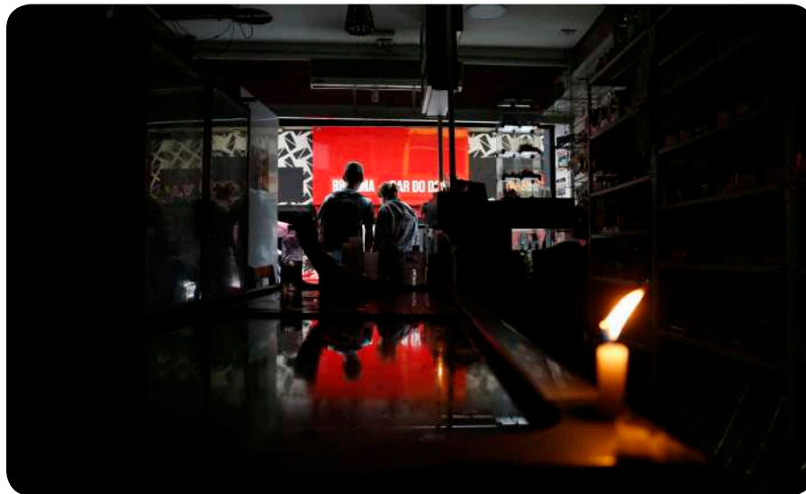
Apagão deixou milhões de pessoas sem luz, algumas por mais de três dias, em SP

A concessão da Enel para a distribuição de energia na região metropolitana de São Paulo foi assinada em outubro de 1998, durante o governo Mário Covas, e tem um prazo de 30 anos.